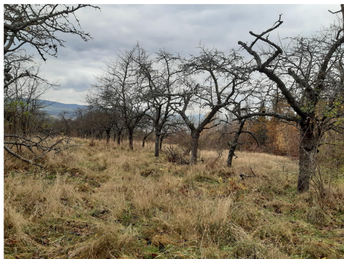
Obrazová příloha - bod 1